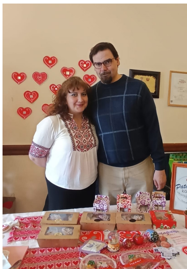
Patagonija Kolači con su rica repostería croata