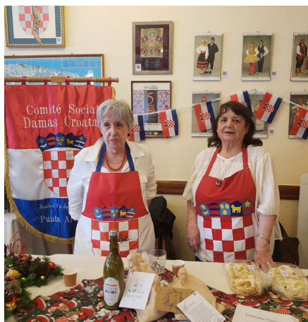
Damas Croatas y las infaltables hrštule