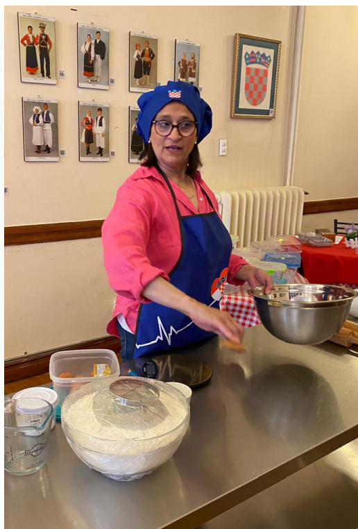
Empezando a cocinar.