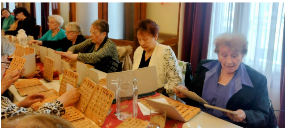
Vista parcial 3