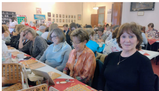
Vista parcial 2