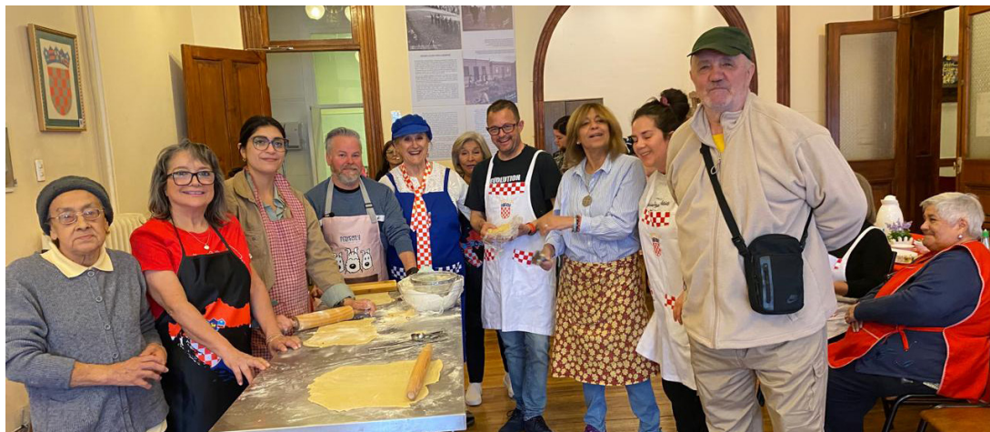
Grupo de participantes