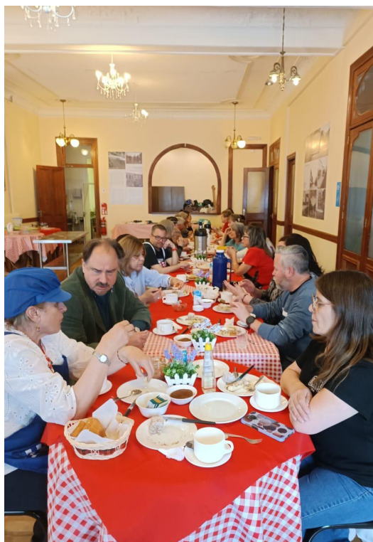
Disfrutando de una rica once.