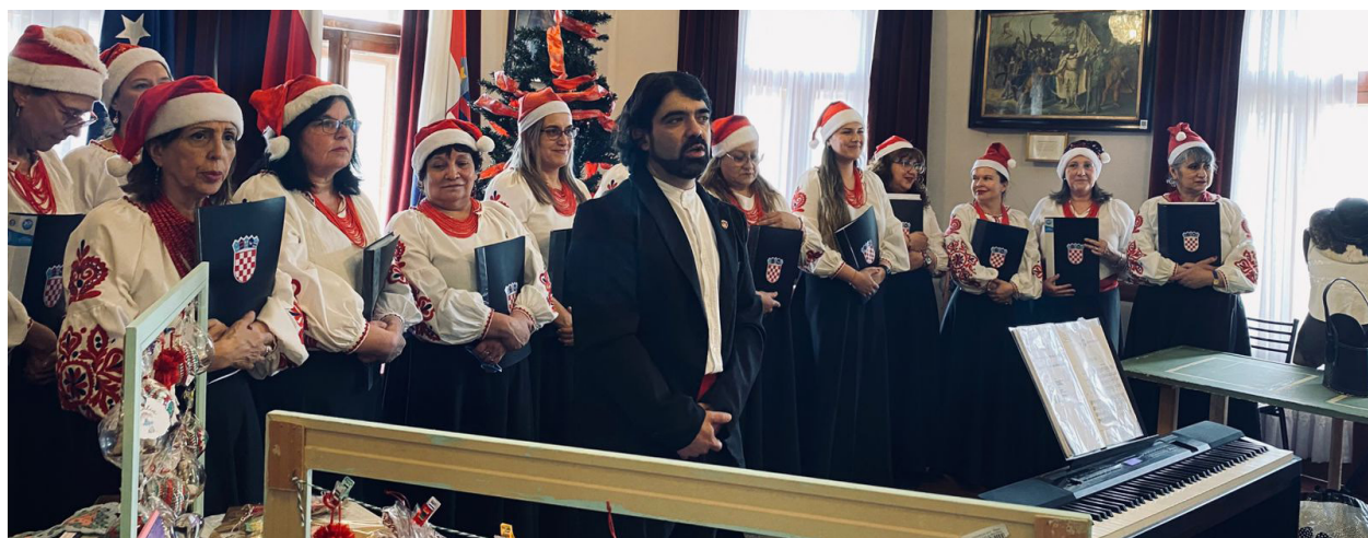
Presentación Coro "Daleki Jadran"