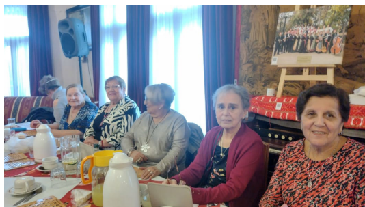
Vista parcial 1